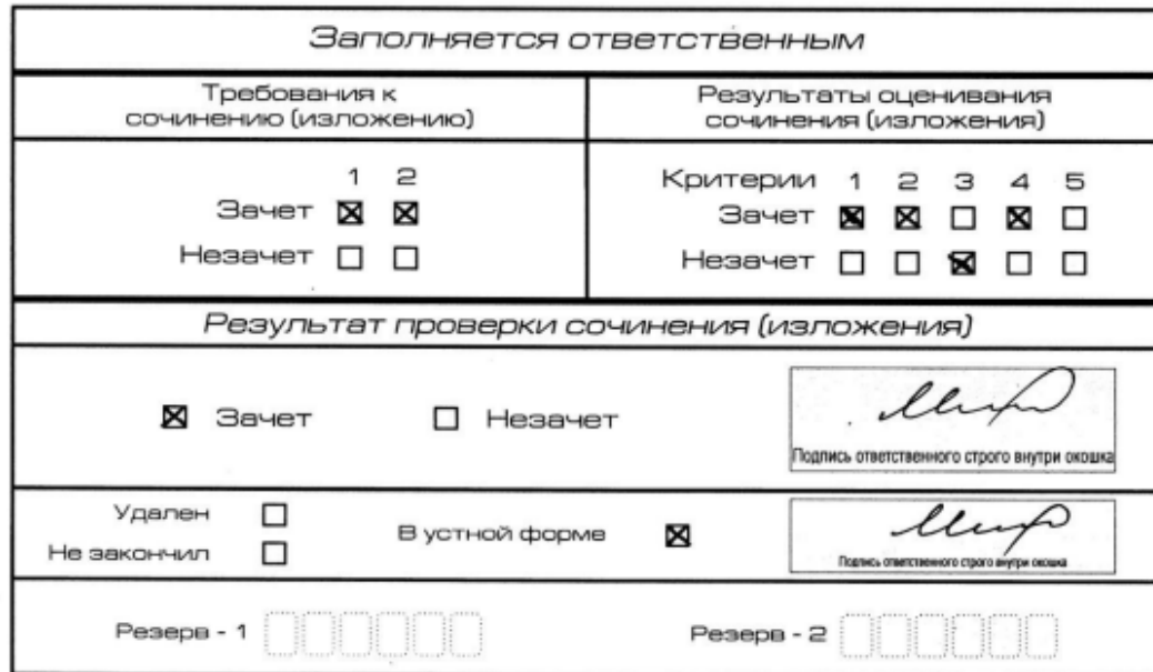
Рис. 11. Область для оценки работы сочинения (изложения) в устной форме