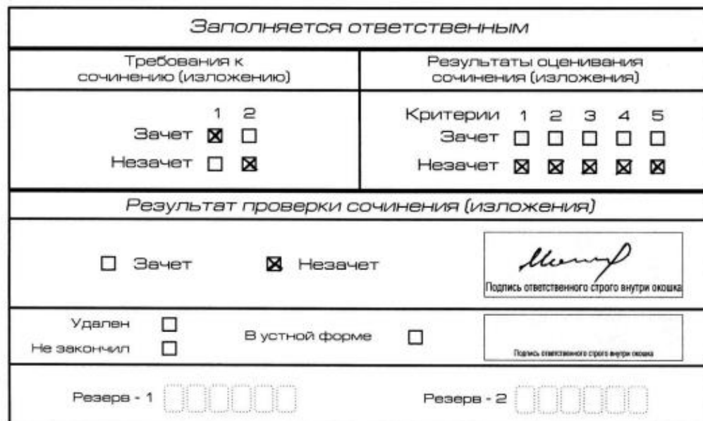
Рис. 9. Область для оценки работы