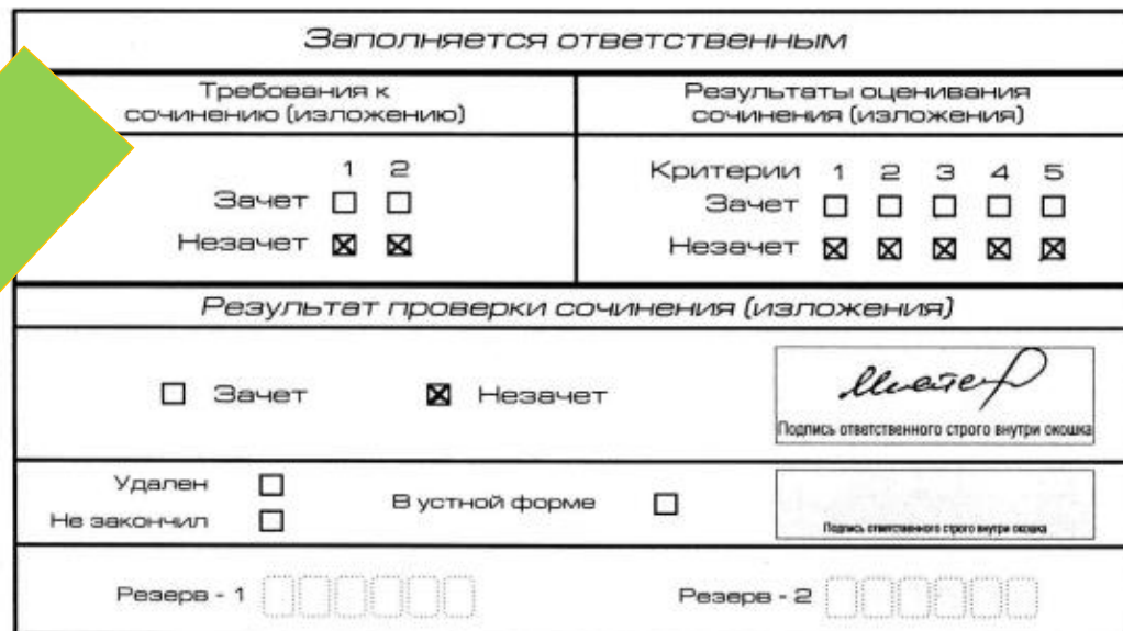
Рис. 8. Область для оценки работы